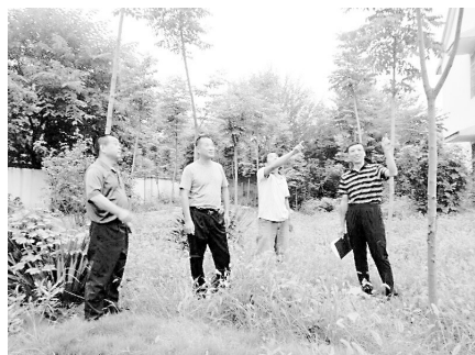
作者(右一)和扶贫工作队成员考察苗木